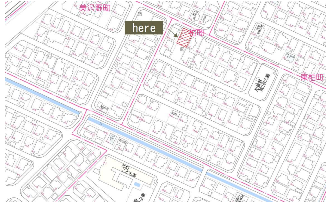
※2枚目に広域地図あります